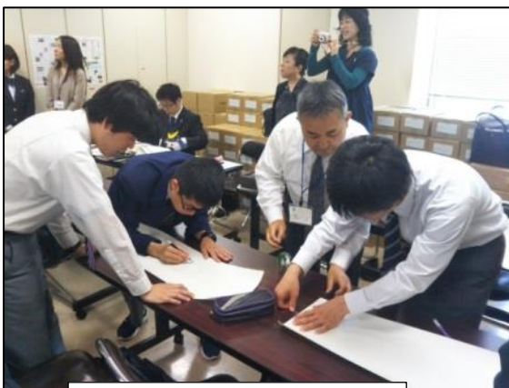
実行委員会での作業風景

私は、実行委員として昨年度から運営に参加しています。開会式で行う手話での呼びかけや、各学校発表の準備が着々と進んでいます。名取支援は、3年生23名が高等部の代表として参加します。8月3日に藤崎百貨店で、作業製品販売の他に、ステージ発表として書道パフォーマンスとダンス，合奏を披露します。とても緊張すると思いますが、友達と楽しんで参加したいと思います。応援をよろしくお願いいたします！