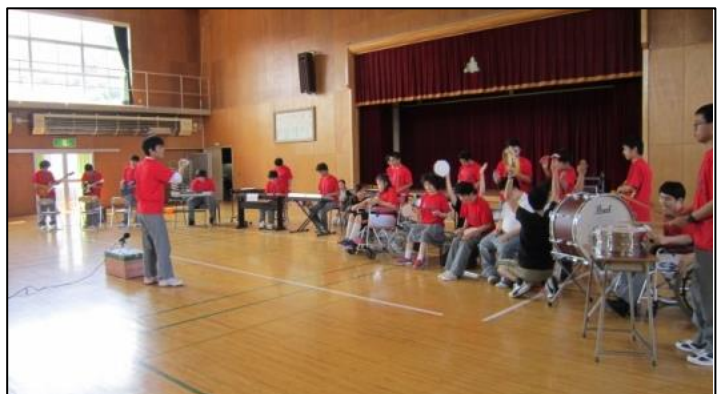
おそろいのTシャツでの校内合奏練習風景